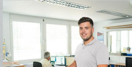
Bachelor of Arts (m/w/d) BWL – Spedition, Transport und Logistik