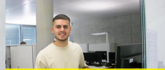
Kaufmann (m/w/d) für Spedition und Logistikdienstleistung