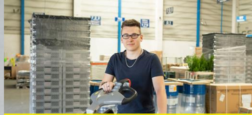
Fachlagerist (m/w/d) | Fachkraft (m/w/d) für Lagerlogistik