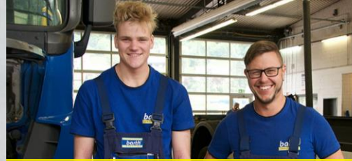
Kfz-Mechatroniker (m/w/d) Nutzfahrzeugtechnik