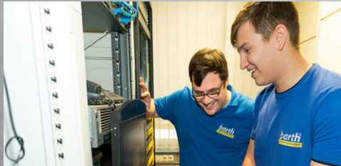
Fachinformatiker (m/w/d) Fachrichtung Systemintegration | Anwendungsentwicklung