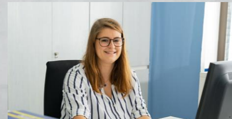
Bachelor of Arts (m/w/d) BWL – Personalmanagement | Personaldienstleistung